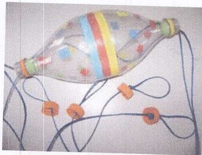
Exemplo de criação

Observando que toda criança gosta de criar, nessa oficina elas aprendem a expressarem-se através do aproveitamento de materiais recicláveis. Através da reciclagem podemos mostrar como podemos transformar incentivando a criatividade, dando segurança para explorarem todos os materiais e possibilidades.