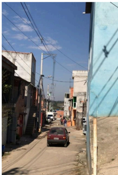
Rua 08 - Viela da mata passa a se denominada ”Rua da Mata”.