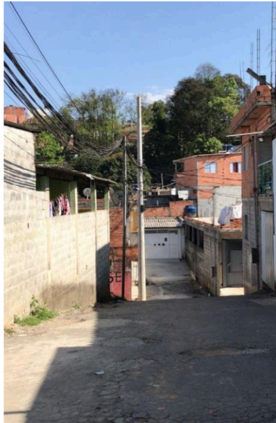
Rua 09 - Rua sem denominação passa a ser denominada “Aldeci Pimenta”