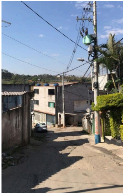
Rua 03 - Rua Raul Pompéia passa a aumentar a sua extensão até o número 67