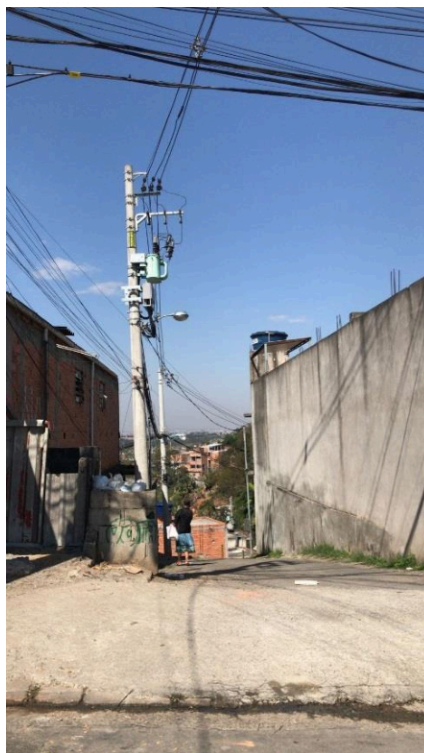
Rua 15 - Rua sem denominação passa a ser denominada “Rua Ramalho Verde”