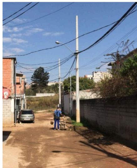
Rua 02 - Rua sem denominação passa a ser denominada de “Rua São Marcos