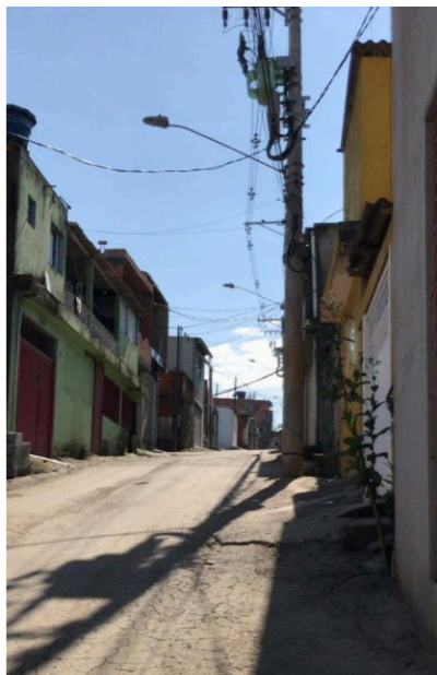
Rua 04 - Rua José Martins continua passa a ser denominada “Rua José Martines”.