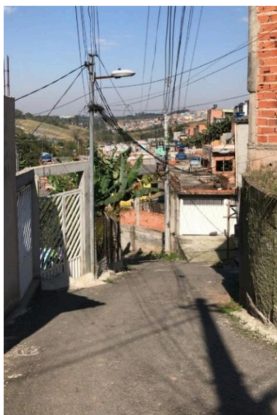
Rua 06 - Viela Um passa a se denominada “Euclides da Cunha”