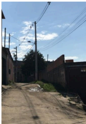
Rua 05 - Rua sem denominação passa a ser denominada “Anita Barbosa”