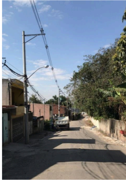
Rua 01 - Estrada São Joaquim da Barra passa a aumentar a sua extensão até a bifurcação da Rua Raul Pompéia