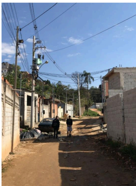
Rua 16 - Viela cinco passa a ser denominada “Viela Pedro Almeida”