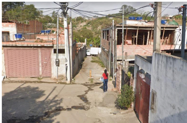
Rua 10 - Viela sem denominação passa a ser denominada “Viela Nossa Senhora da Aparecida”