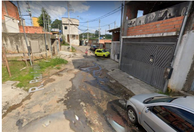
Rua 07 - Trecho da Rua Raul Pompéia até a bifurcação da Estrada São Caetano do Sul passa a ser denominada “Hélcio dos Santos”