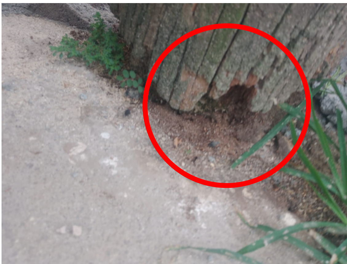
Imagem Ref. Requerimento solicitando a troca de Poste de madeira

Obs: Base de sustentação está desgastada e podre.