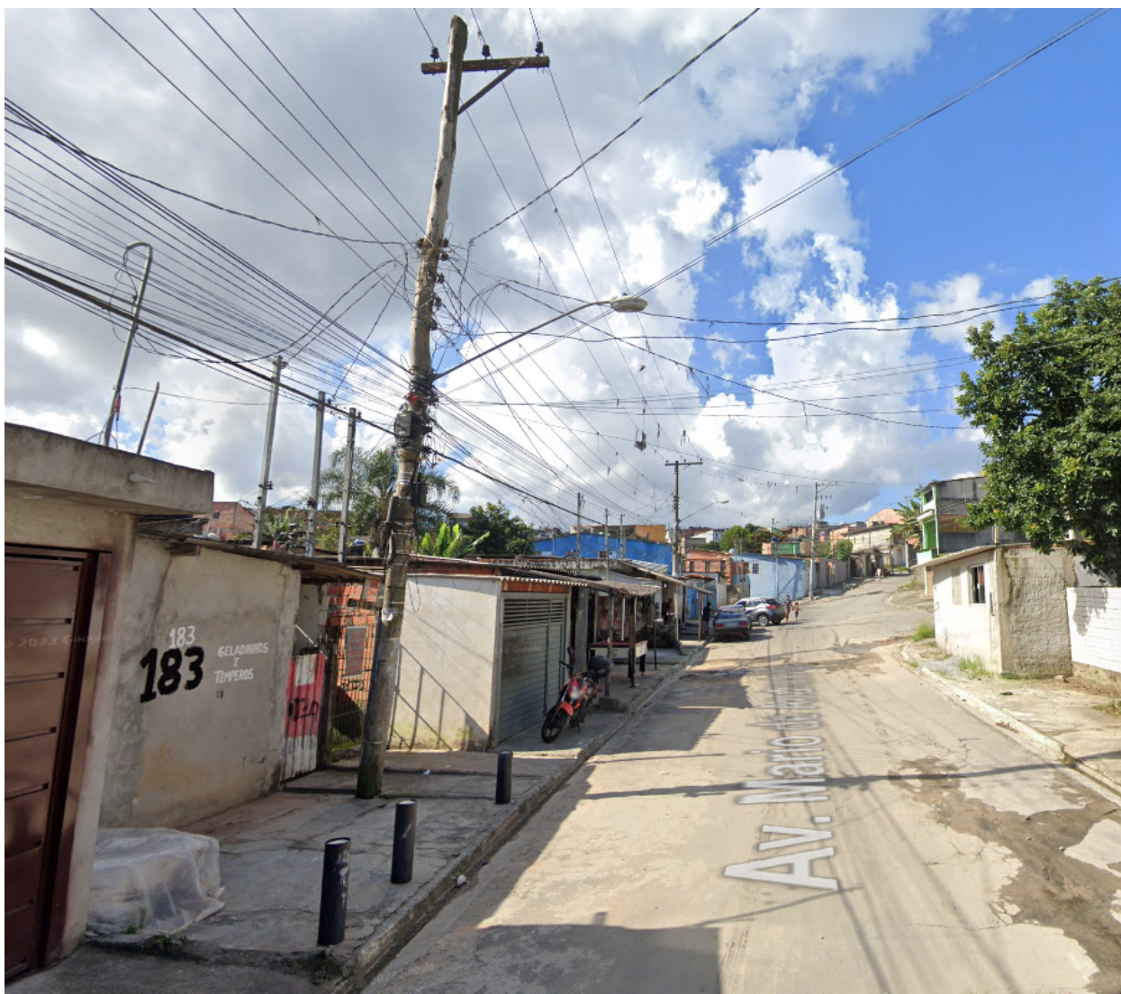
Imagem do poste de sustentação da fiação elétrica. (desnivelado)