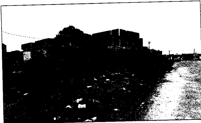
RUA SEBASTIÃO JOSÉ DE ALMEIDA - JARDIM ZELIA

Imagens Referente Indicação: Solicitando a Limpeza e Isolamento do Prédio da UBS Jardim Zélia.