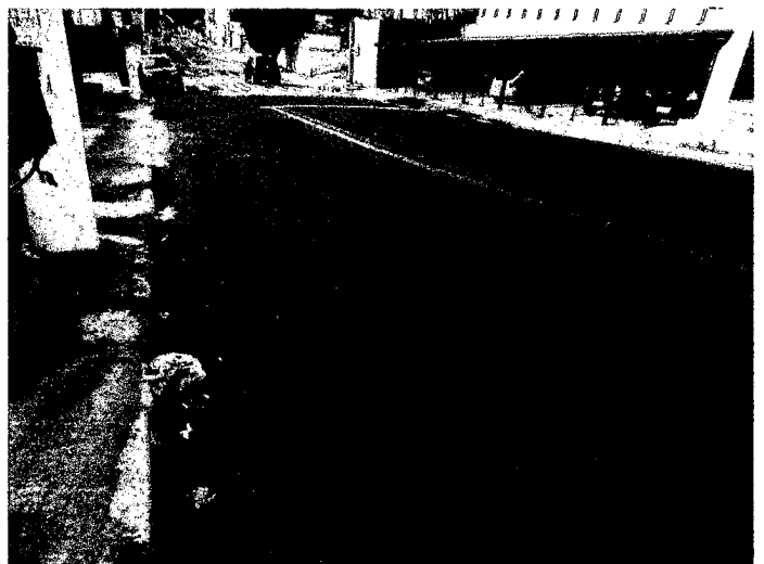
Nº Próximo ao nº. 1.111