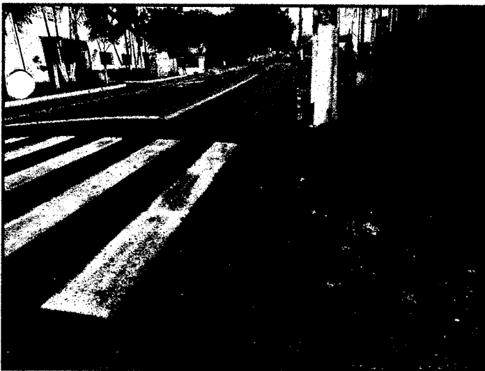
Local: Nº. 90 Av. Uberaba

Imagens Ref. Requerimento da Av. Uberaba