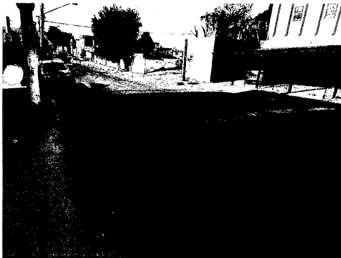
Nº 1.111 da Av. Uberaba