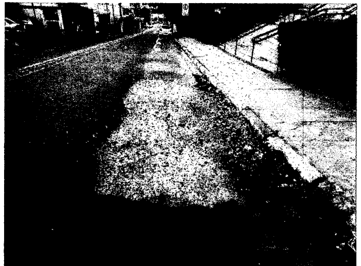
Nº. 216 da Av. Uberaba