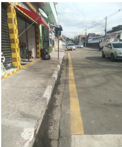
Sinalização, Proibido Estacionar

INDICO À MESA , nos termos regimentais, solicitando ao Excelentíssimo Senhor Prefeito Municipal, a remoção da faixa amarela na Avenida Uberaba na altura do número 529 a 497 no Bairro Vila Virginia, neste município.