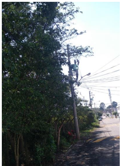
Imagem do local