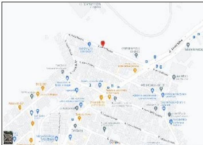
Croqui do local

Rua Murilo Mendes, entre o número 28 até confluência da Rua Teófilo Braga -Parque Piratininga – Itaquaquecetuba/SP