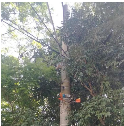
Imagem da fiação entrelaçadas com os galhos

Imagens do local: Ref. Solicitação de Poda de Árvores