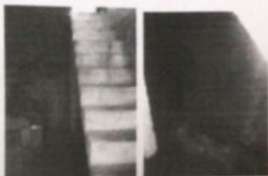
Casa r. Jorge Lima 210 ao lado escada infiltrado