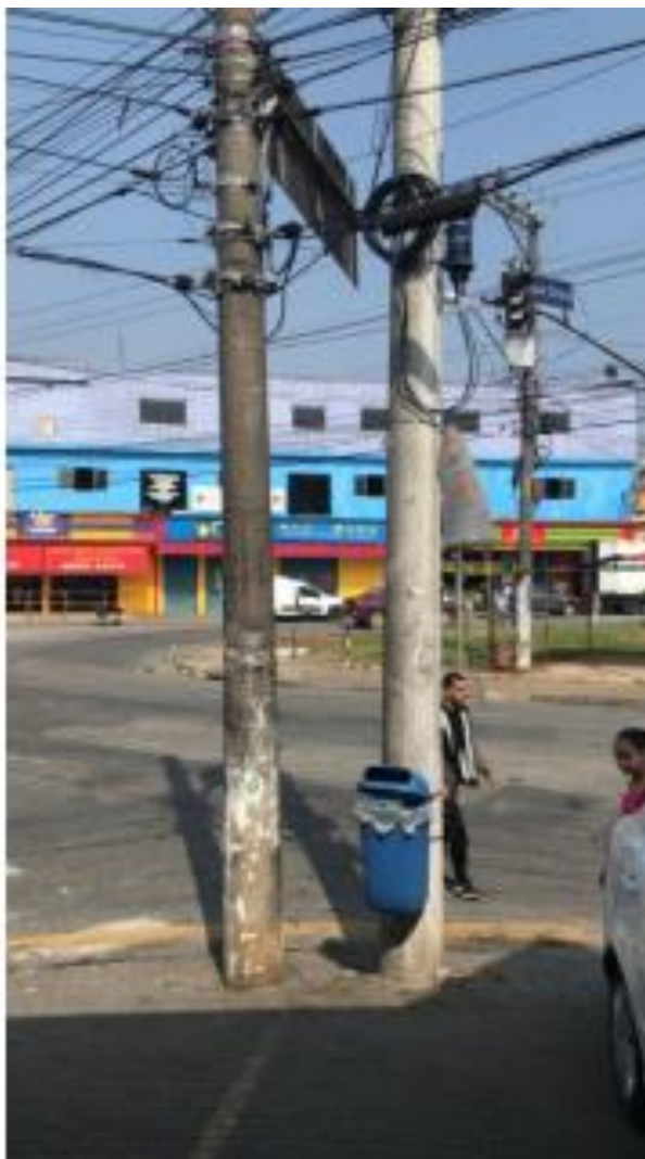
Estrada da Água Chata com Rua Joaquim Caetano