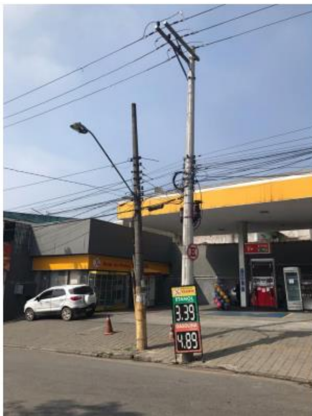
Estrada da Água Chata com Rua João Francisco Lisboa