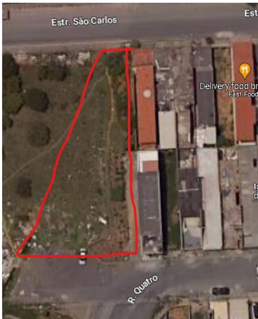
Rua Sara Barbosa dos Santos do lado n. 152..Jd Maria Rosa.