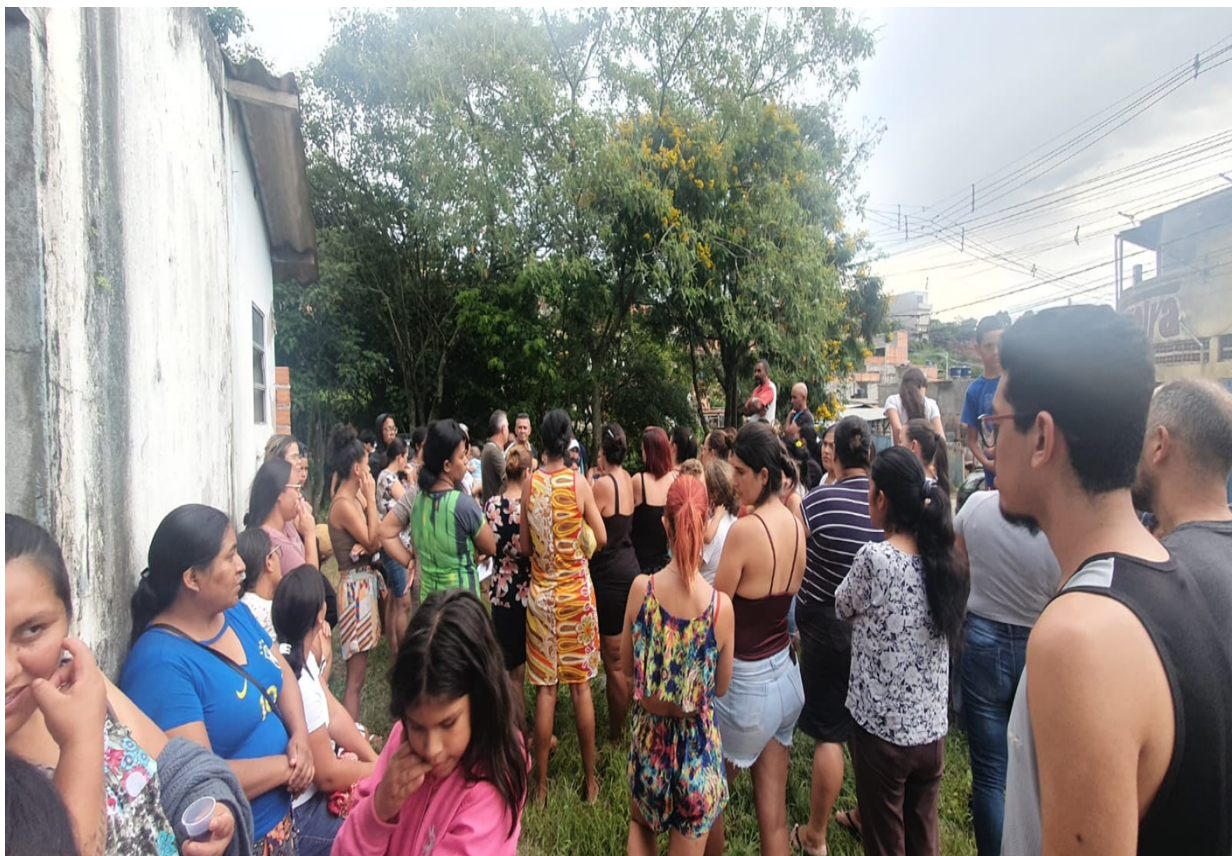
Foto reunião 26/02 Jardim Maria Rosa