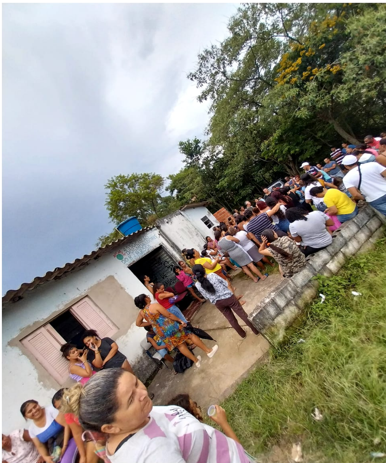
Foto reunião 26/02 Jardim Maria Rosa