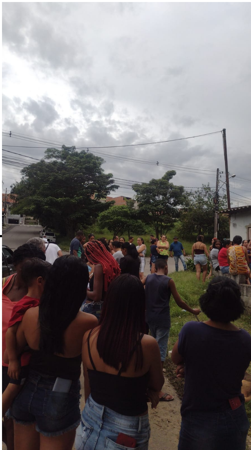
Foto reunião 26/02 Jardim Maria Rosa