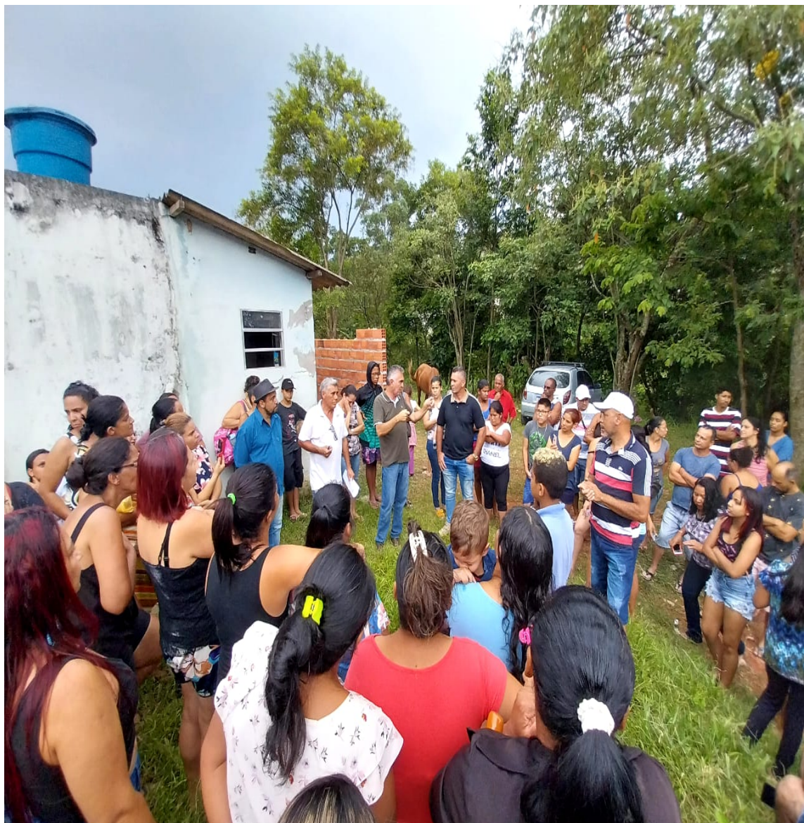
Foto reunião 26/02 Jardim Maria Rosa