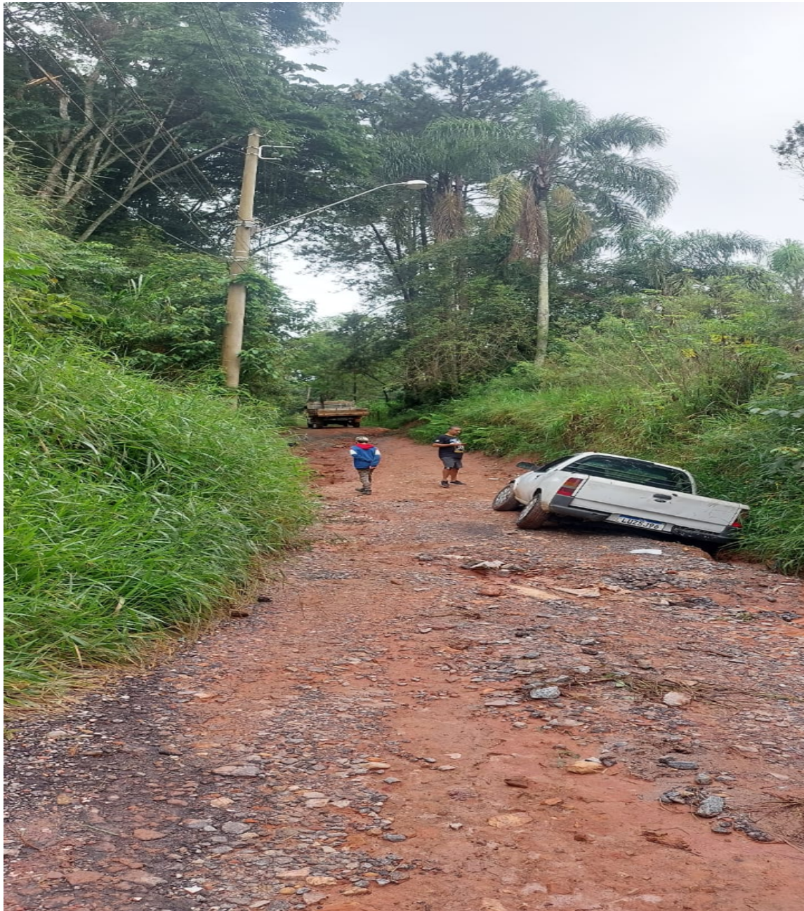
ESTRADA DO PIM