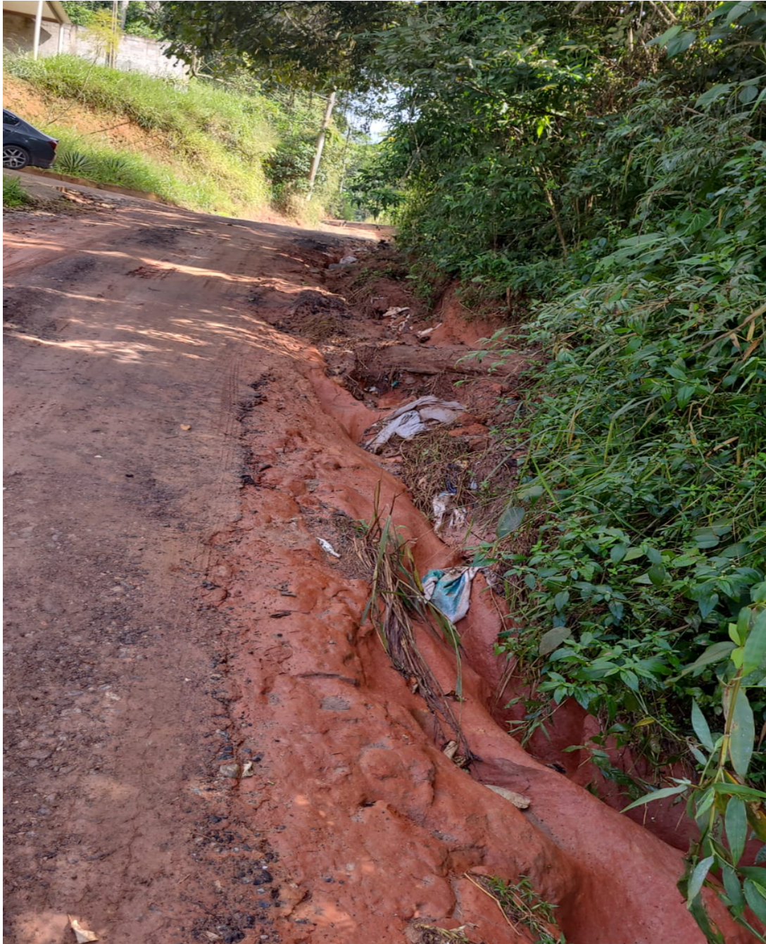
ESTRADA DO PIUM