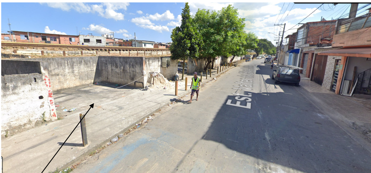
Estrada Valter da Silva Costa, entre o número 560 ao 440 – Bairro Vila Sônia - Itaquaquecetuba