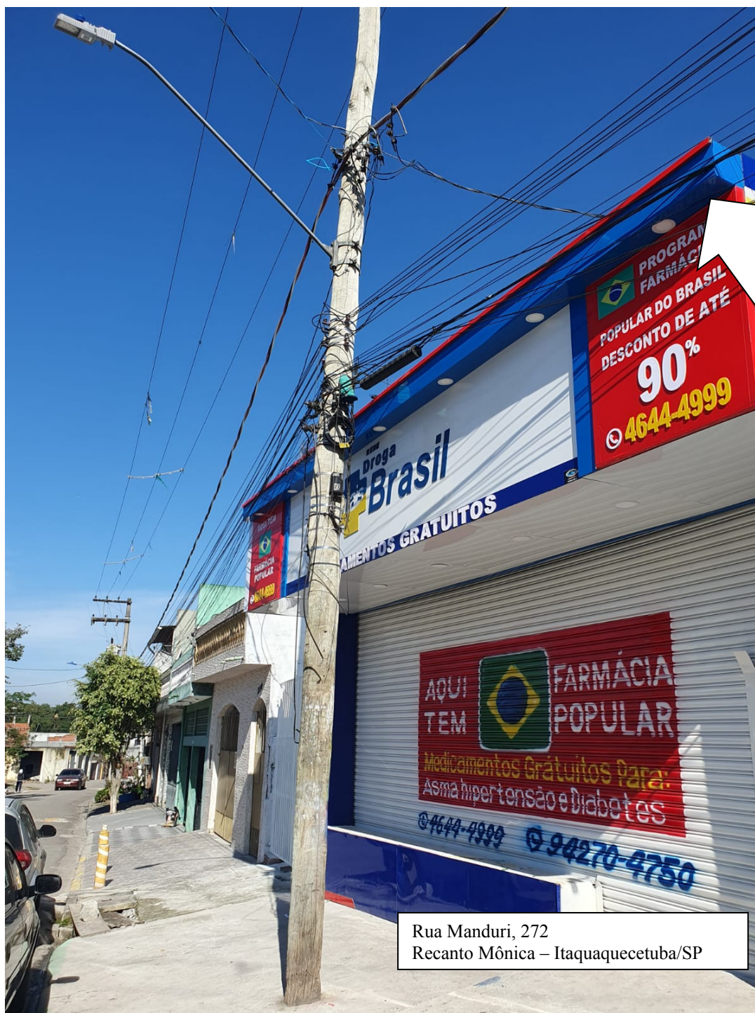
Imagem Ref. Requerimento solicitando afastamento da Rede e Fiação Elétrica

Rua Manduri, 272 Recanto Mônica – Itaquaquetuba/SP