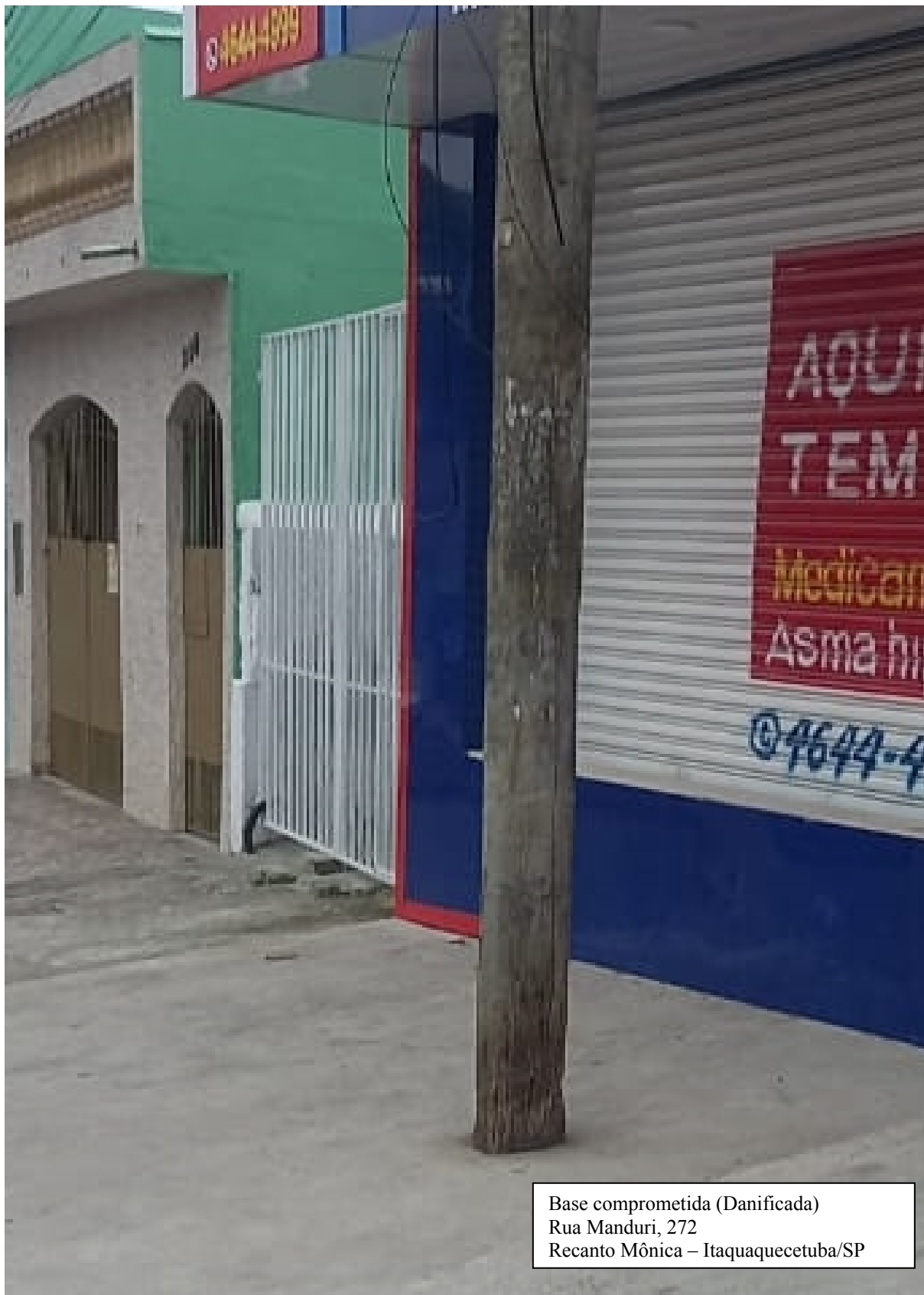
Base comprometida (Danificada) Rua Manduri, 272 Recanto Mônica – Itaquaquetuba/SP