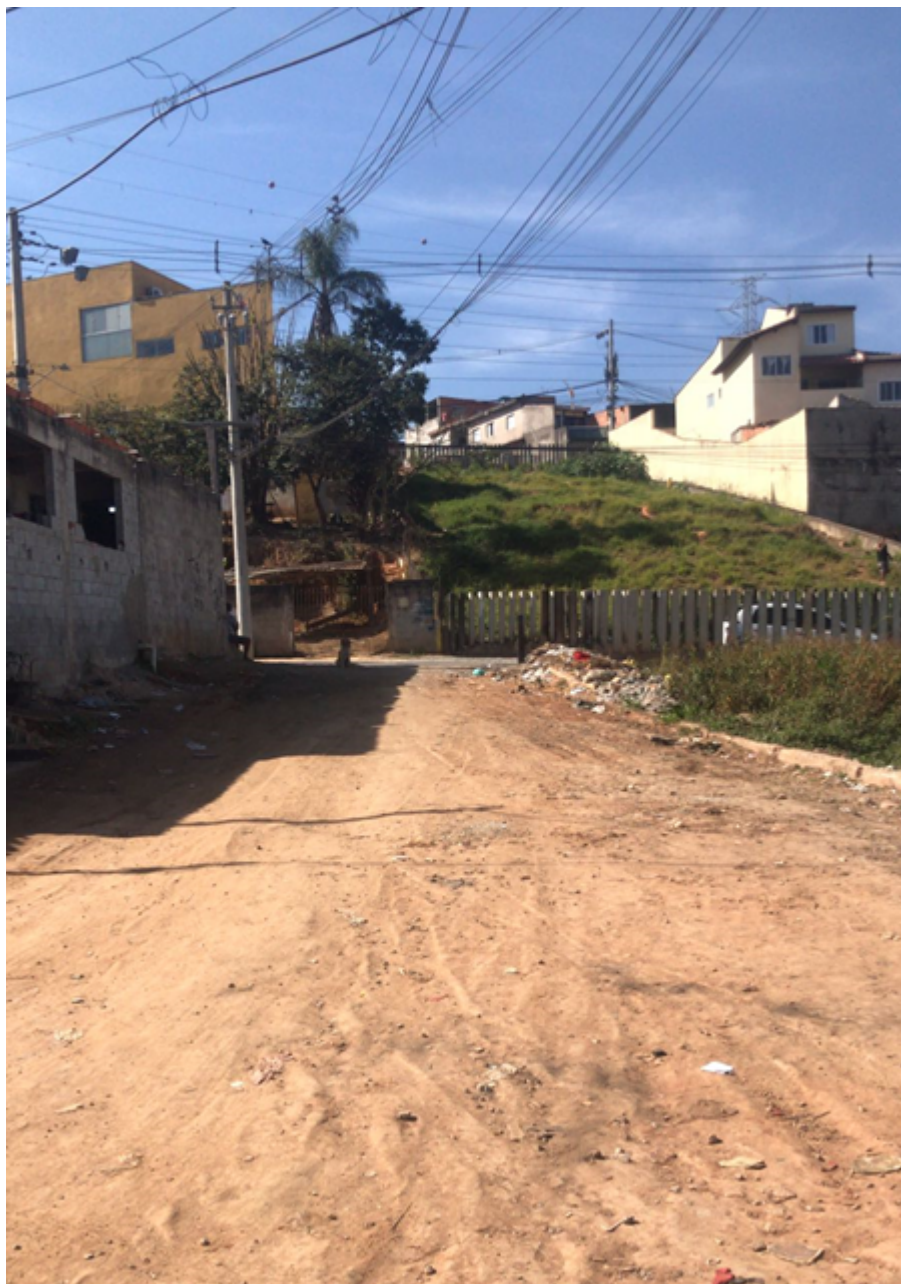
Rua Gaspar Lemos