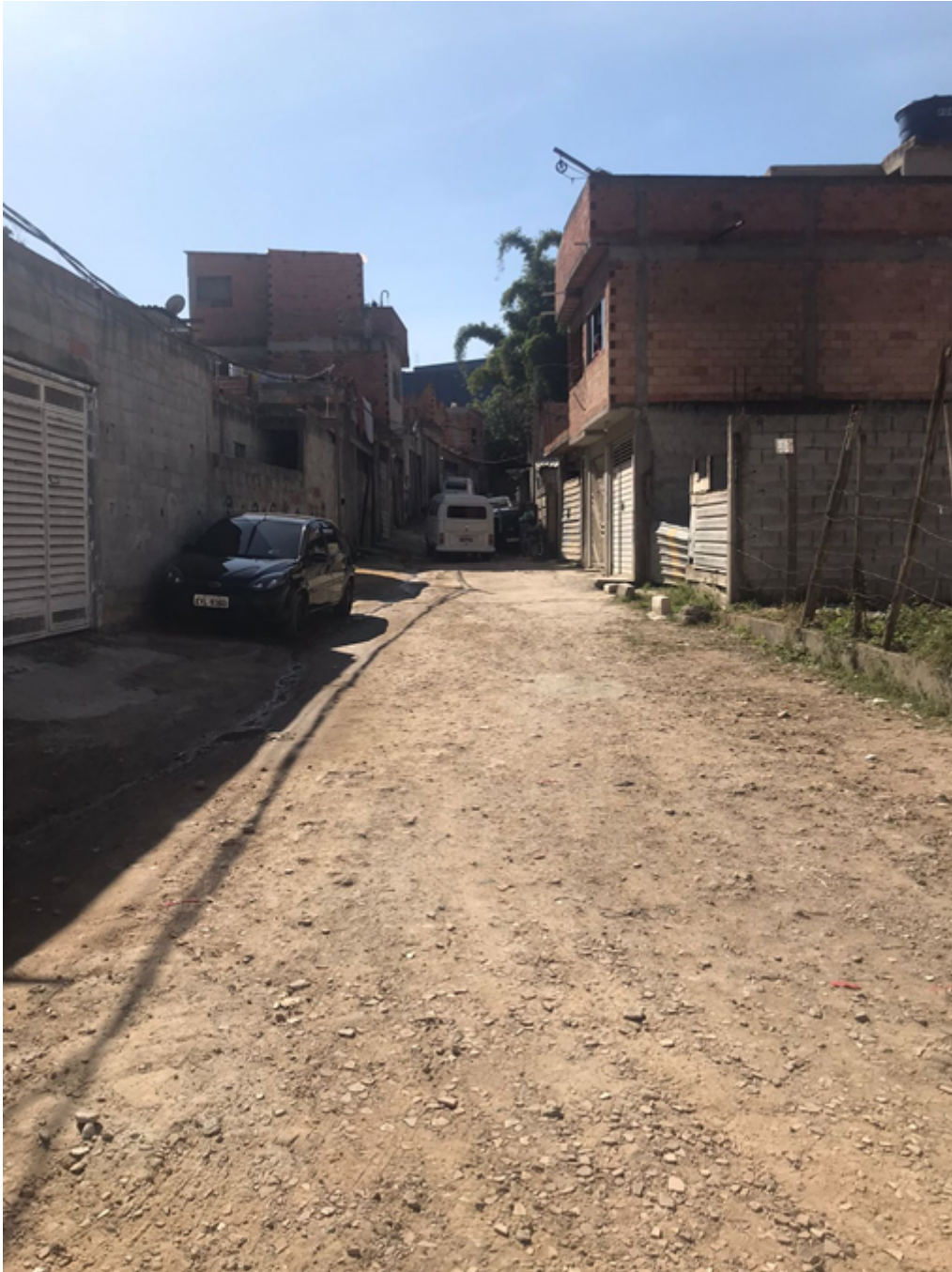
Rua dos Nordestinos