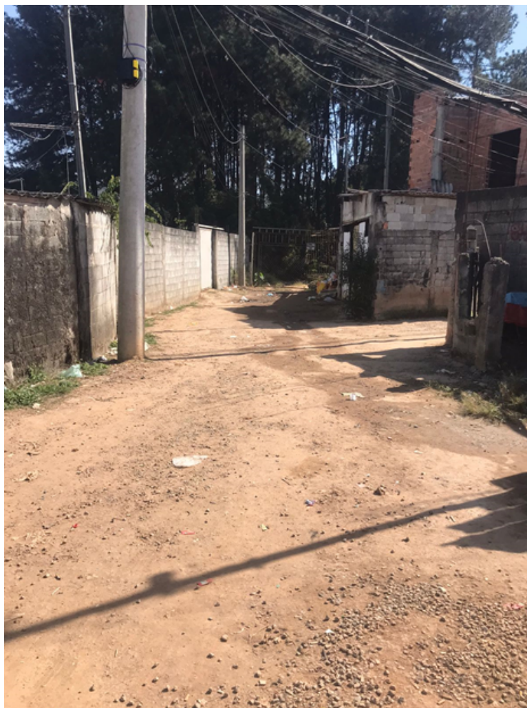
Vielas São Pedro