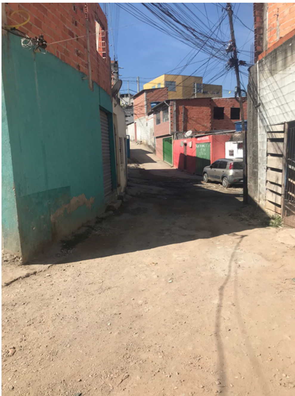
Rua Levi Lemos