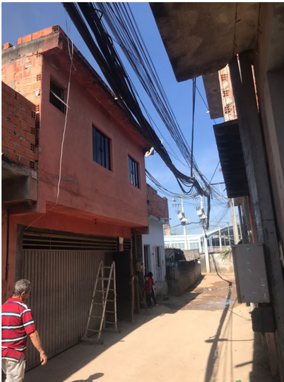
Rua São Vicente