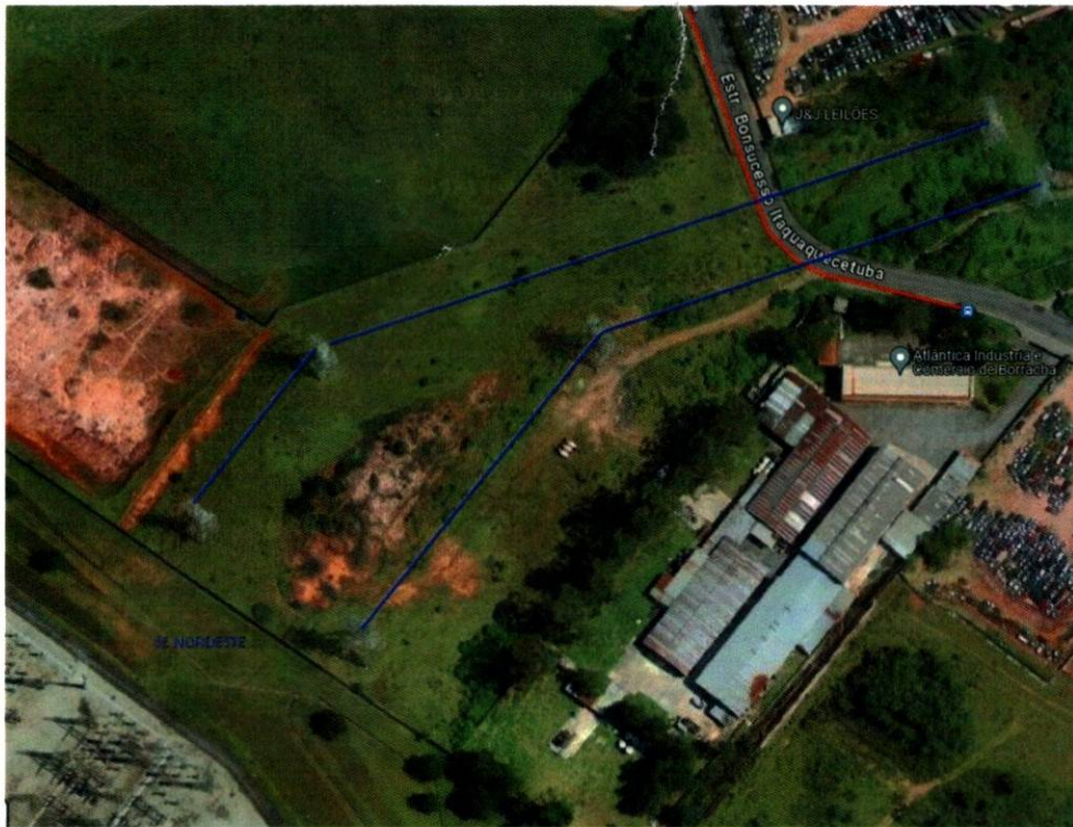
Figura 3: Circuitos de transmissão que saem da SUB NORDESTE SP 345/88 kV.