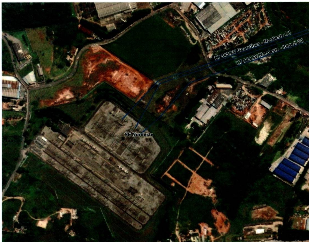
Figura 1 - Subestação Nordeste-SP.