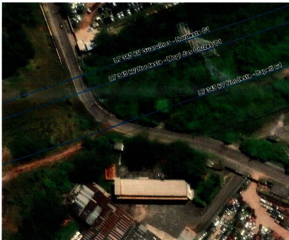
Figura 4: Circuitos de transmissão que saem da SUB NORDESTE SP 345/88 kV, LT 345 kV Guarulhos - Nordeste C1, LT 345 kV Nordeste - Itapeti C1 e LT 345 kV Nordeste - Mogi das Cruzes C1.

2.4. Em resposta ao Requerimento nº 95/2014, a Agência Nacional de Energia Elétrica (ANEEL), por meio do Ofício nº 244/2015-SCR/ANEEL, de 27 de julho de 2015, contido no Protocolo 00868/2015 Câmara de Itaquaquecetuba (SEI nº 0840608 ), esclarece em termos do contrato de concessão de serviço público de transmissão nº 062/2001 que a transmissora tem liberdade para gerir seus negócios, comprometendo-se a garantir bons níveis de qualidade do serviço público, inclusive no tocante à segurança, cortesia, integração social e preservação do meio ambiente. E conclui que a empresa FURNAS SP não há impedimento regulatório para que a transmissora atenda aos pleitos da Câmara Municipal,