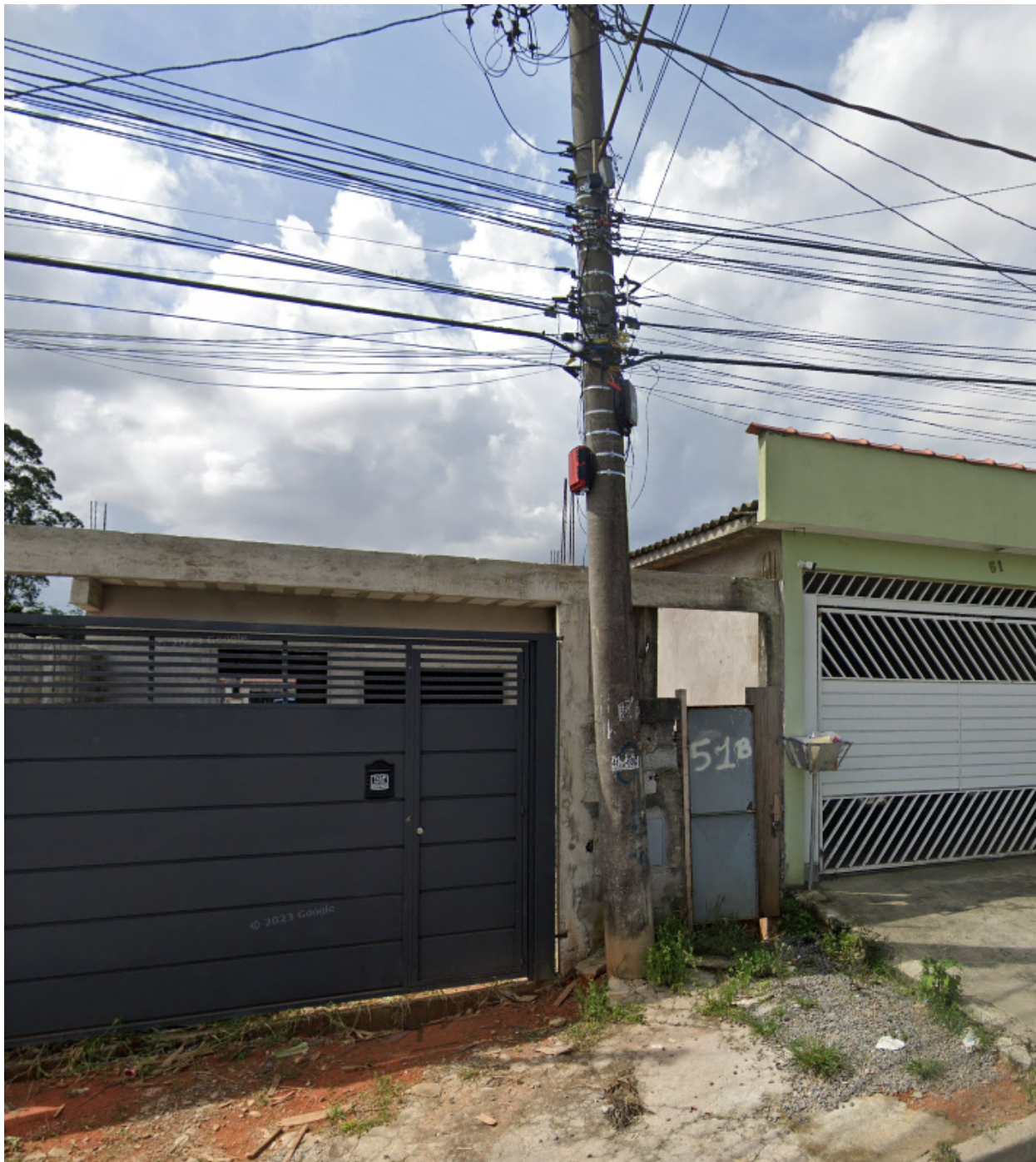
Imagem Ref. Requerimento solicitando afastamento da Rede e Fiação Elétrica