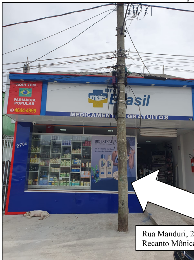
Imagem Ref. Requerimento solicitando afastamento da Rede e Fiação Elétrica

Rua Manduri, 272 - A Recanto Mônica – Itaquaquecetuba/SP